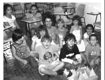
Sala de aula da infância: alegria em trabalhar com os pequeninos