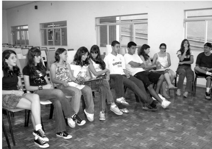
Jovens da MEMA fazem atividade nas reuniões de sábado à tarde no IEBO

Foi muito legal, demos muitas risadas, estreitamos laços de afeto, aprendemos muito, não só em relação ao tema, mas também em relação as nossas potencialidades. Mas, a coisa não ficou por aí. Depois de nossa apresentação, nada mais justo do que propormos um “desafio” ao GEA não é mesmo? Pois é, escolhemos um tema nem um pouco polêmico: “Baladas” (rsrsrs). Ah! Tiveram que estudar, pesquisar... Mas saíram-se muito bem e nós da mocidade também, pois tivemos a oportunidade de ouvir o ponto de vista de vários pais que também partici-